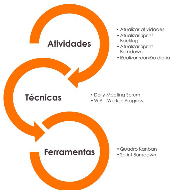
Figura 6 – Estrutura do Processo P5 – Alinhamento Diário

Este processo está estrutura da seguinte forma: