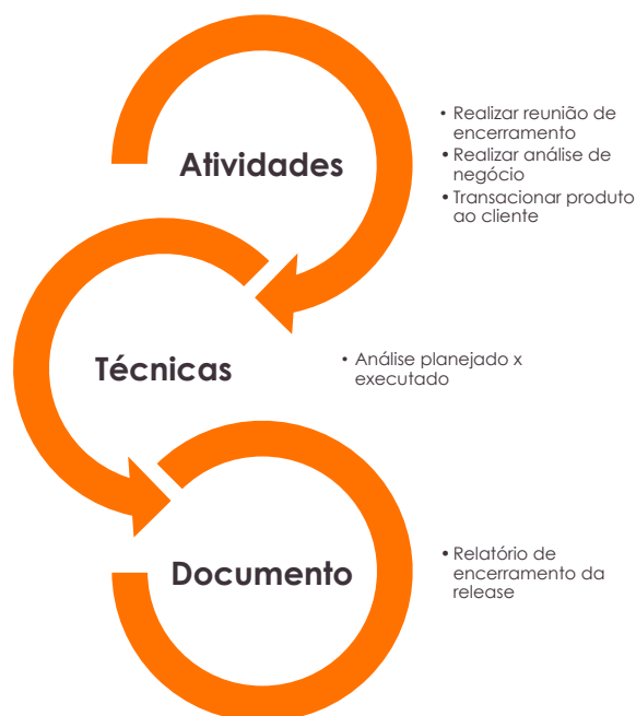
Figura 9 – Estrutura do Processo P8 – Encerramento da Release

Este processo está estrutura da seguinte forma: