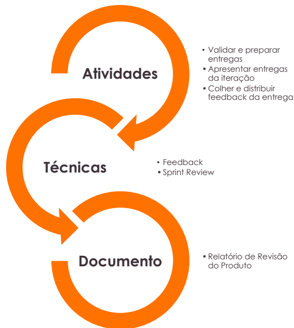
Figura 7 – Estrutura do Processo P6 – Realização das Entregas

Este processo está estruturado da seguinte forma: