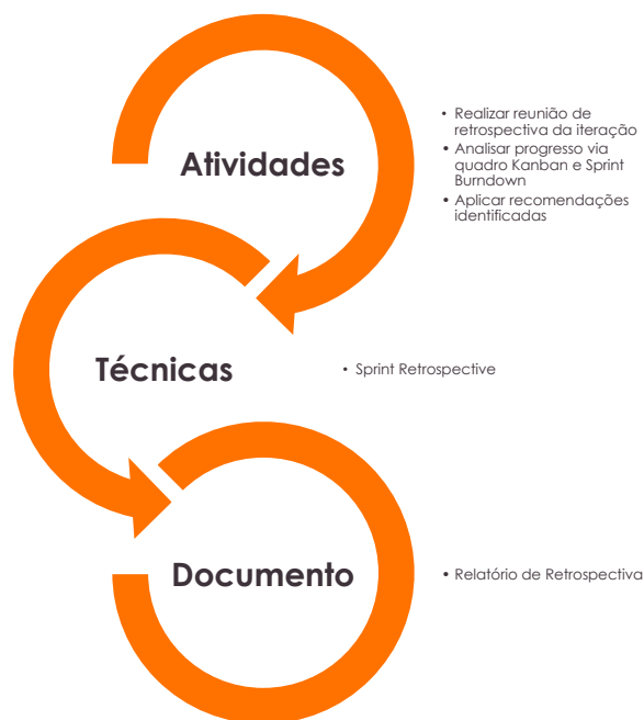
Figura 8 – Estrutura do Processo P7 – Retrospectiva da Iteração

Este processo está estruturado da seguinte forma: