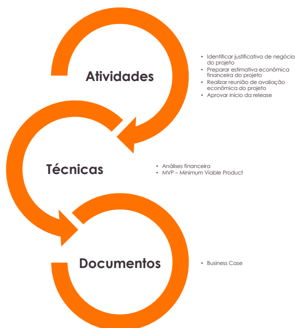
Figura 3 – Estrutura do Processo P2 – Análise de Viabilidade do Negócio

Este processo está estrutura da seguinte forma: